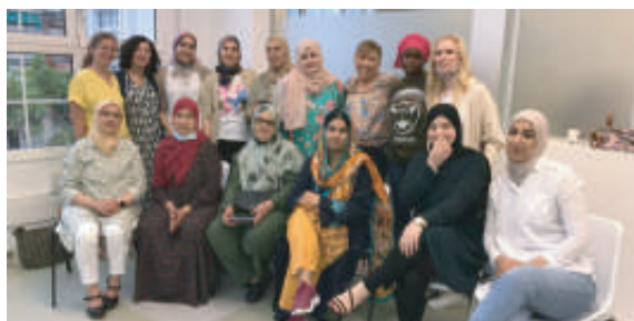
Trobada de fi de curs 2022 amb dones, alumnes de castellà, 3 nivells.