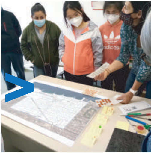
Sessió del projecte Rehabilitació climàtica dels barris . Alumnat de català