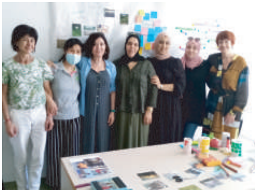
Taller de Jiser sobre Com (ens) cuidem? Amb dones alumnes de castellà